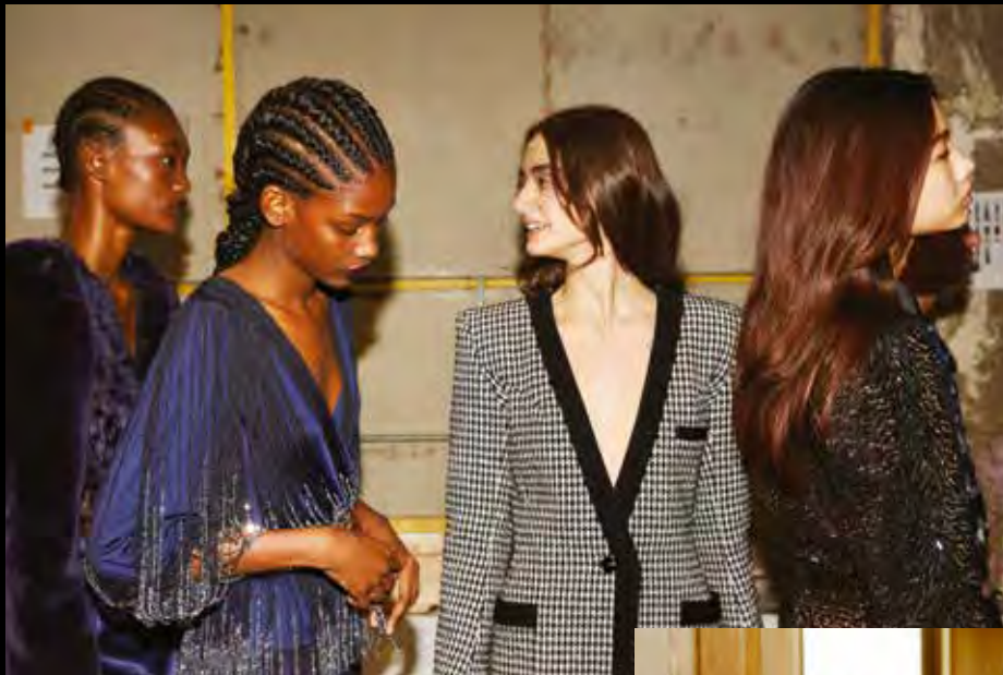
© Thibaut de Saint Chamas para René Furterer durante el desfile Azzaro