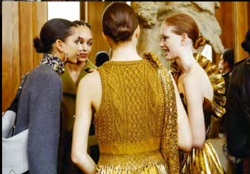
© Thibaut de Saint Chamas para René Furterer durante el desfile Altuzarra