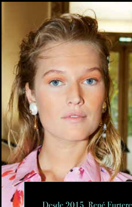
© Thibaut de Saint Chamas para René Furterer durante el desfile Altuzarra